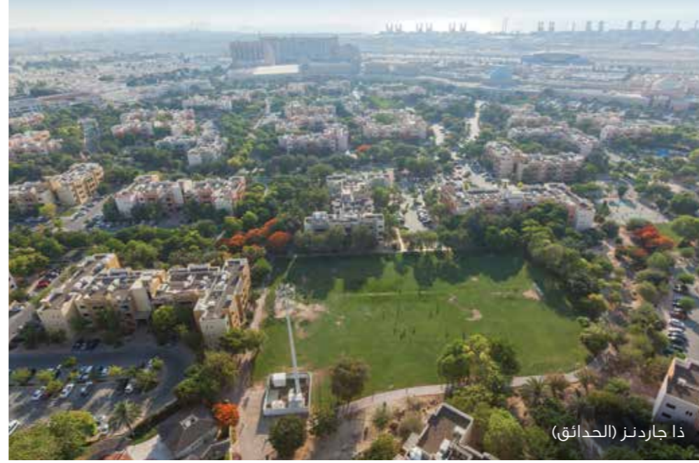
ذا جاردنز (الحدائق)